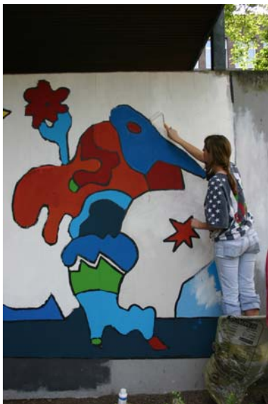
Projektwoche Mai 2005 Ein Wandgemälde wird restauriert