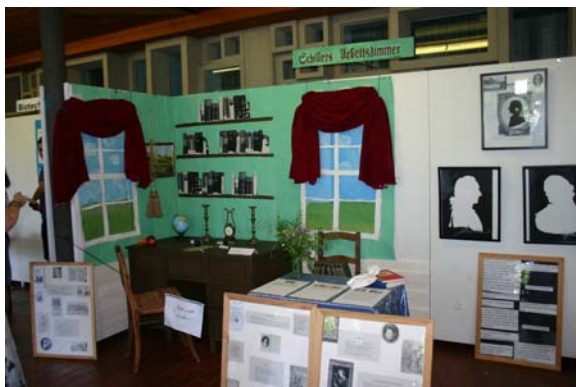
Projektwoche Mai 2005 Wo Schiller gedichtet hat Rekonstruktion seines Arbeitszimmers