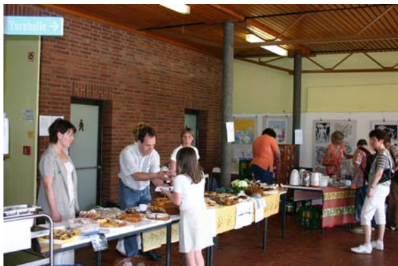
Projektwoche Mai 2005 Eltern versüßen die Präsentation